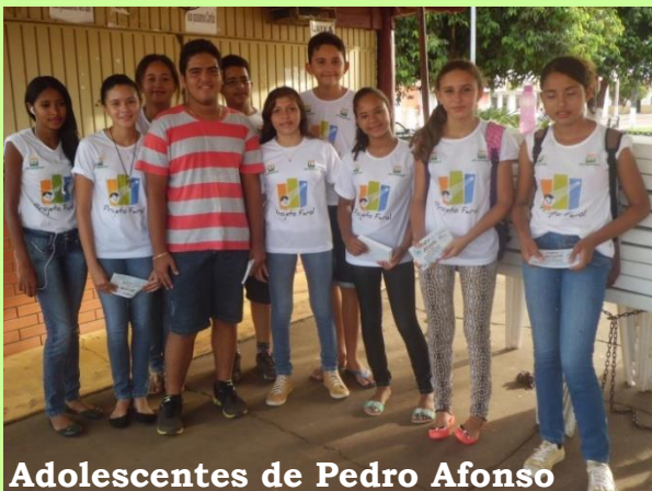
Adolescentes de Pedro Afonso

No mesmo período, o tema foi abordado durante uma roda de conversa com crianças e professores/as da aldeia Salto, em Tocantínia. No local, foram distribuídos panfletos alertando sobre a violência sexual no idioma akwê.