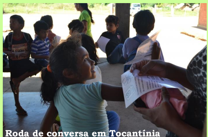
Roda de conversa em Tocantínia