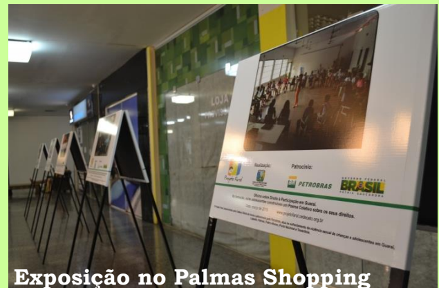
Exposição no Palmas Shopping

Além dessas atividades, foram propostas e executadas ações específicas para o 18 de maio - Dia Nacional de Enfrentamento ao Abuso e à Exploração Sexual de Crianças e Adolescentes .